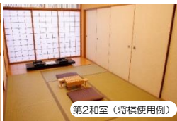
第2和室 (将棋使用例)