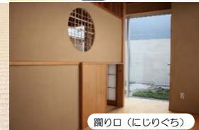
廻り口 (にじりくち)