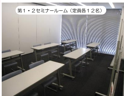
第1・2セミナールーム (定員各12名)

プラザノース3階にある第1～第7セミナールームをご紹介します。セミナールームは会議室仕様で、定員数分の椅子と机が設置され、会議や説明会だけでなくものづくりや手芸、語学など趣味の集まりにご利用いただけます。第7セミナールームはパソコン室でZoomも使えます。ぜひ！ご利用ください。