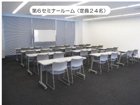
第6セミナールーム (定員24名)