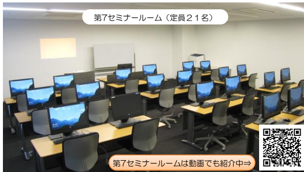
第7セミナールーム (定員21名)