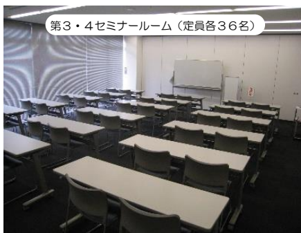
第3・4セミナールーム (定員各36名)