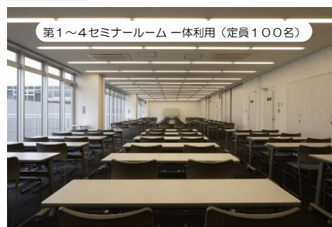
第1～4セミナールーム 一体利用 (定員100名)

◆第1～第4セミナールームは可動壁を外して 利用することが出来ます (一体利用)。