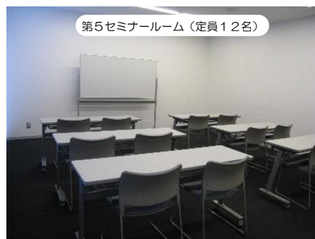
第5セミナールーム (定員12名)