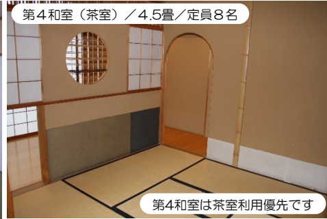
第4和室は茶室利用優先です