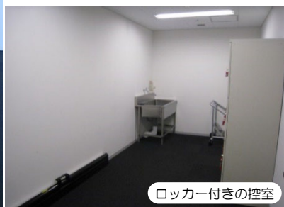
ロッカー付きの控室

CGアトリエは、プロジェクターやスクリーンなどの充実した備品がすべて無料で使用でき、会議や講演会に最適なお部屋です。また、セミナールームに比べ室内が広く飲食も可能なため、同じ2階にある多目的ルームやノースギャラリーで発表会やイベントを開催する際の控室利用にも適しています。