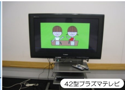
42型プラズマテレビ