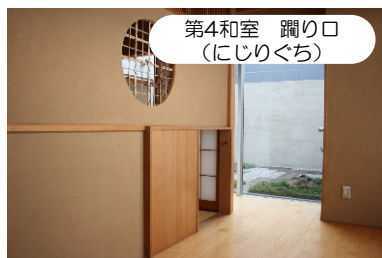
第4和室 踊り口 (にじりくち)