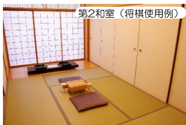
第2和室 (将棋使用例)