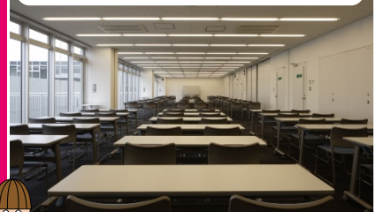
第1～4セミナールーム 一体利用（定員100名）

◆利用方法、登録手続き、各種備品などは総合インフォメーションカウンターまでお問い合わせください。