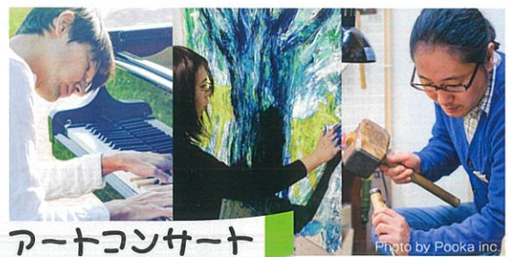
アートコンサート